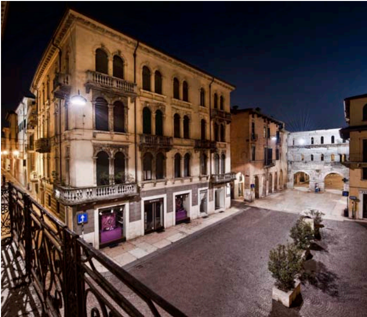
PALAZZO VICTORIA, VERONA