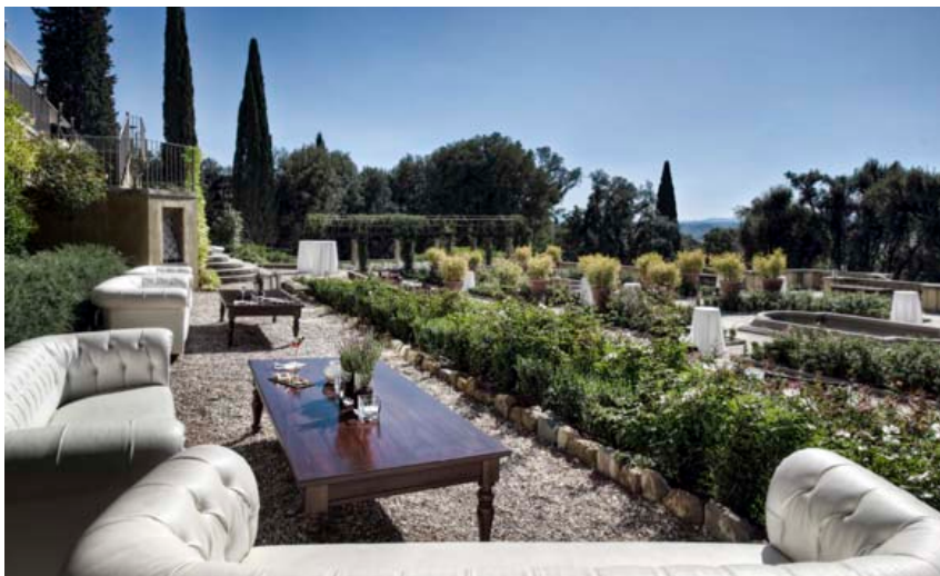
IL SALVIATINO, FLORENZ